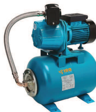
FOT. ČERPADLO JET 100 S VYBAVENÍM + NÁDRŽ 24