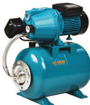
FOT. ČERPADLO JET 100 S VYBAVENÍM + NÁDRŽ 24