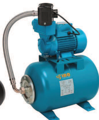
FOT. ČERPADLO WZI 750/750 S VYBAVENÍM + NÁDRŽ 24