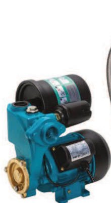
FOT. ČERPADLO WZI 250/750 S VYBAVENÍM