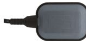
PLOVÁKOVÝ SPÍNAČ OLA INOX