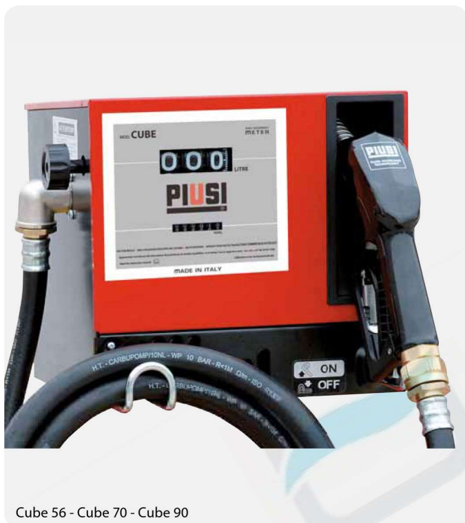
Cube 56 - Cube 70 - Cube 90